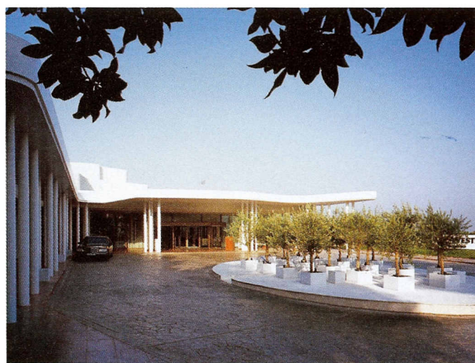
Στέγαστρο στο Ξενοδοχείο Ναυσικά, Αστέρας Βουλιαγμένης

Προσεγγίζει κανείς το Ξενοδοχείο Ναυσικά μέσω του τελευταίου επιπέδου (όρο) στην κορυφή μίας απότομης πλαγιάς. Κλιματιστικές εγκαταστάσεις στο δάμα, ορατές από την είσοδο, η ανάγκη για ένα νέο στέγαστρο και η αναβάθμιση των τριών καταστημάτων, διαμόρφωσαν το πρόγραμμά μας. Επάλληλες καμπύλες από λευκές μεταλλικές περσίδες, που τοποθετήθηκαν γύρω από τους αγωγούς κλιματισμού στο δάμα, δημιουργούν ένα ενδιαφέρον παιχνίδι ανάμεσα στο φως και την ημιδιαφάνεια. Η καμπύλη μορφή του στέγαστρου προεκτείνεται και στις δύο πλευρές για να δημιουργήσει την αίσθηση του περικλειστού. Τα λευκά υψίκορμα υποστυλώματα εισάγουν την καθετότητα. Τα καταστήματα μετατρέπονται σε λευκά μαρμάρινα κουτιά που εισχωρούν στον βράχο.